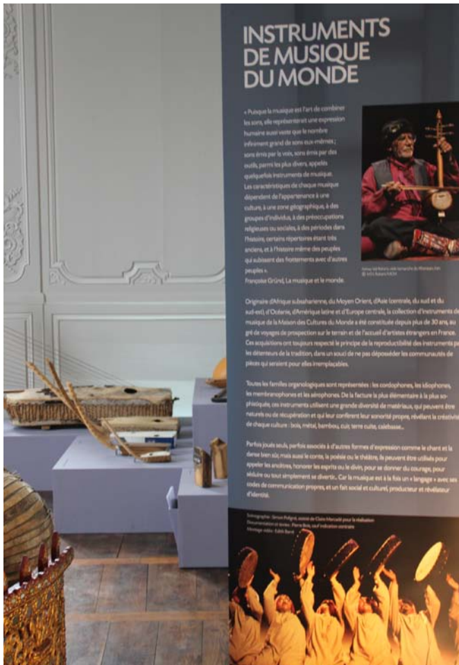
Instruments de musique du monde