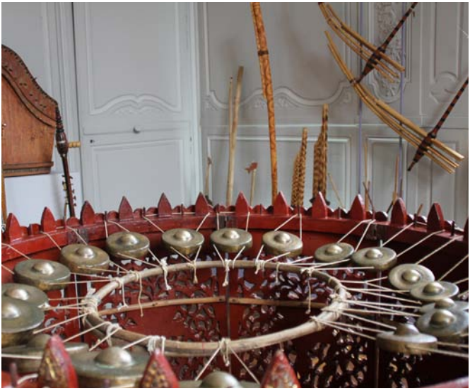
Jeu de gong de l'ensemble Birman hsaing waing