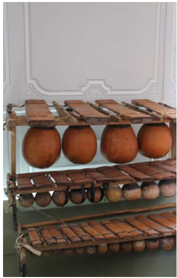
Xylophones Timbila du Mozambique