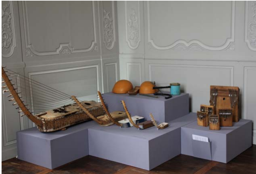
Ensemble instrumental des Acholi d'Ouganda