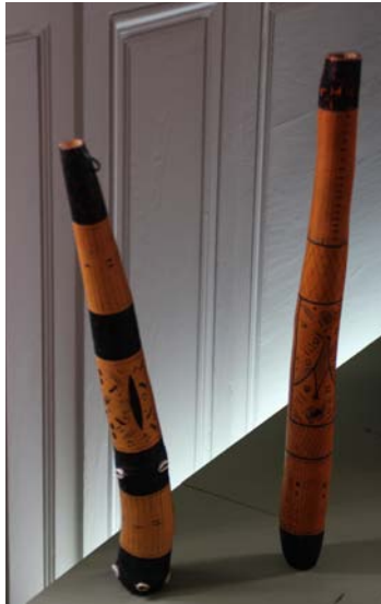
Shantus, idiophones du Nigéria